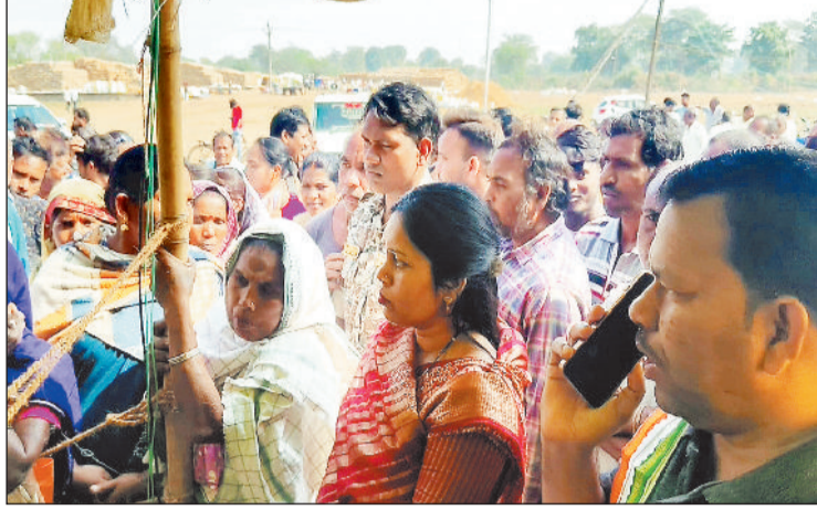
उप खरीदी केंद्र के बाहर प्रदर्शन करते किसान और समर्थन में पहुंची विधायक।